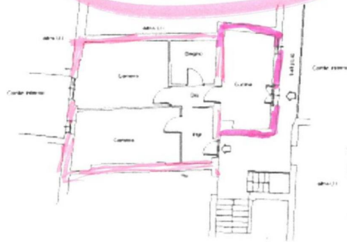
Pianta piano QUARTO Hint=2.50mt

ATTICO SISTEMI FUCCI C.so Vittorio Emanuele II n° _____ TORINO Tel. 011 591959 (011 595909) - _____ 547718 info@atticosistemi.it Partita IVA 09865800010 Iscrizione Ruolo Mediatori _____